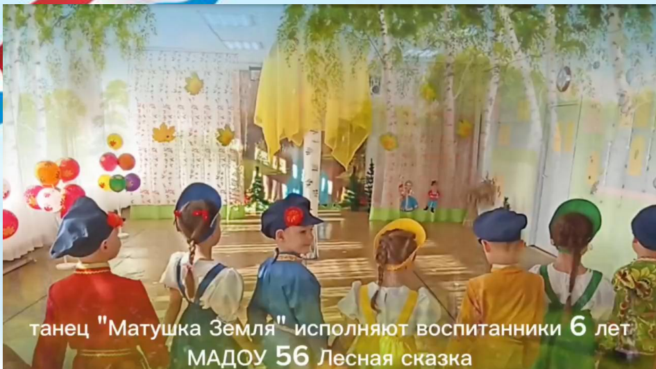
танец "Матушка Земля" исполняют воспитанники 6 лет МАДОУ 56 Лесная сказка

https://disk.yandex.ru/i/tf8g-yS6BSLsUA 56 мадоу танец Матушка Земля