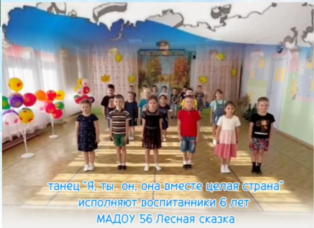
танец "Я, ты он, она вместе целая страна" исполняют воспитанники 6 лет МАДОУ 56 Лесная сказка

https://disk.yandex.ru/i/PUiX1n_Qm2vh6g 56 МАДОУ танец Я Ты Он Она